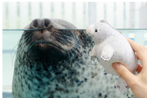
だきしめアザラシボールチェーン