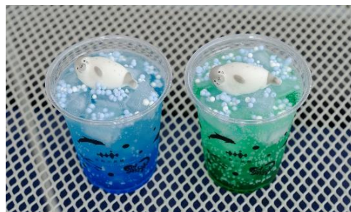
寝そべリアザラシの COOOOOOL ソーダ