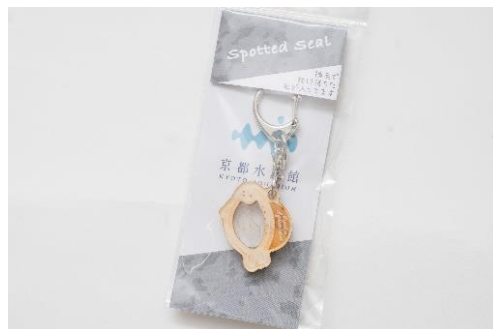
アザラシの毛入りキーホルダー