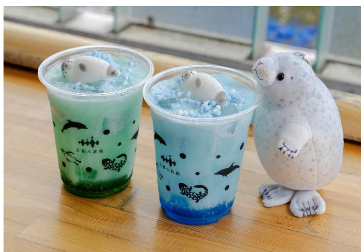
企画展を記念したドリンクやグッズが新登場

京都水族館では、ハマ・シロ・ヒカルの3頭のゴマフアザラシを展示しています。本企画展は、ゴマフアザラシの特徴や生態、さらに、飼育スタッフが“かっこいい!いいね!”と思うアザラシの魅力をお届けしたいという思いから企画しました。