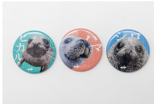
アザラシ缶バッジ（一部抜粋）