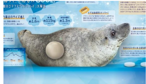
アザラシ等身大パネル（イメージ）

体長約 1.6m のハマのほぼ等身大模型とともにアザラシの体の特徴を解説するパネルを展示します。模型はアザラシのおなかの固さを再現しているため、実際に触ってどんな触り心地か確かめてみましょう。ほかにも、抜けてしまったヒゲと毛や1日のごはんの量を体験できるお魚バケツを展示し、触ったりじっくり観察したりしながらアザラシについて知ることができます。