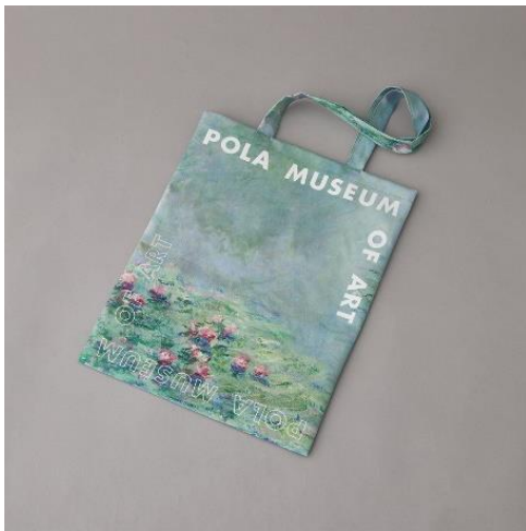
ポーラ美術館ロゴトートバッグモネ《睡蓮》（イメージ）

ポーラ美術館ロゴとクロード・モネ《睡蓮》の絵画作品をデザインしたオリジナルトート。表裏に絵画作品が、優しい色合いでプリントされているので、日常やちょっとしたお出かけのスタイルを上品に演出してくれます。男女問わず使いやすいデザインです。