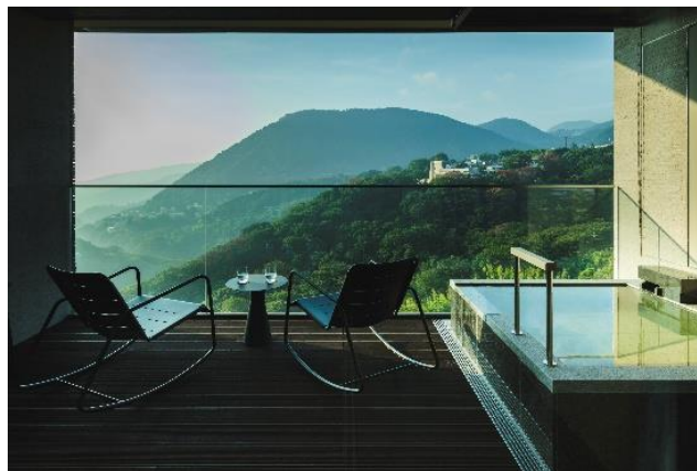
開放感溢れる佳ら久ルームの露天風呂