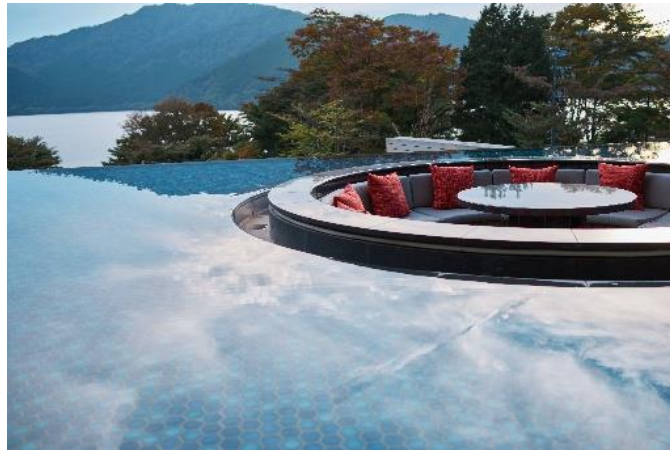
芦ノ湖と一体化するように広がる水盤テラス