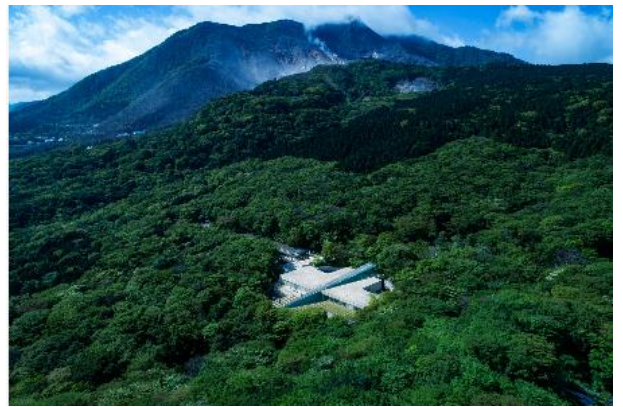
箱根の森に溶け込むように建つポーラ美術館

ポーラ美術館は、箱根の自然と景観に配慮し、高さを地上8mに抑え、建物の多くを地下に配した建築を特徴としています。コレクションは、印象派を中心とする西洋絵画から現代アートまで多岐にわたり、自然の光に満ちた環境の中で、多様な美術作品に触れることができます。