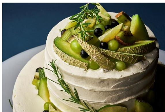
爽やかな色合いのウェルカムケーキ

クロスホテル札幌のランチは、「心おどるカジュアルフレンチ」をコンセプトに展開しています。この夏はフレンチの定番を「アッシュ」らしくアレンジし、シェフが手間を惜しまず調理した全50種と、ライブ感のある演出や季節を味わう夏限定メニューを20種用意します。