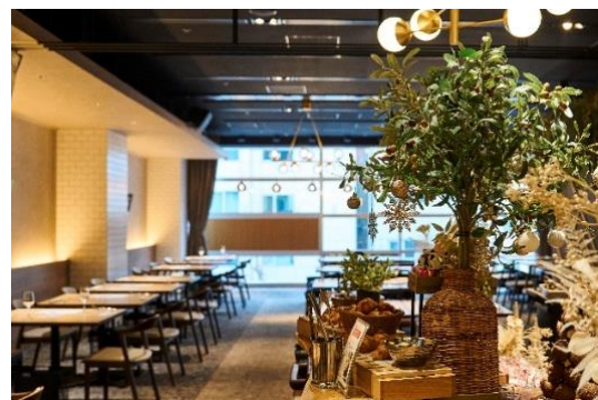
店内の様子(イメージ)

https://cross-sapporo.orixhotelsandresorts.com/contents/lunch-2/