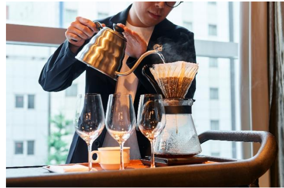
コーヒーはワイングラスでご提供

季節ごとにコーヒーとデザートの内容を変更しており、今夏はさわやかなケニア産スペシャルティコーヒーと夏限定デザートを用意。食後の時間価値まで提案する、レストランアッシュならではの“五感で楽しむ”コンテンツの一つです。