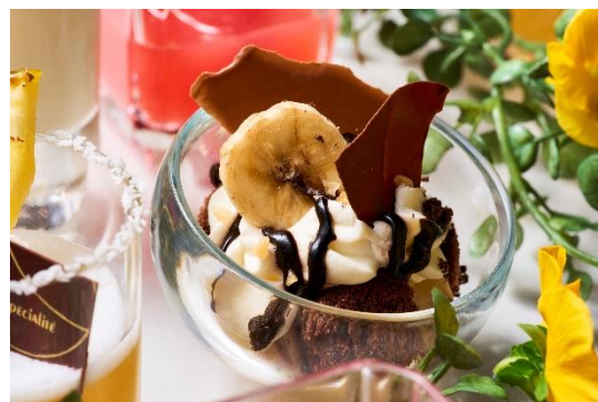
チョコバナナトライフル

チョコレートとバナナを合わせた、ミニサイズのパフェ風デザートです。コクのある甘みが特徴です。