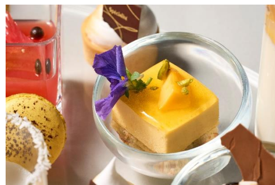
マンゴーとバジルのケーキ

マンゴーの甘みとバジルの爽やかな香りを組み合わせたケーキです。夏らしい味わいに仕上げました。