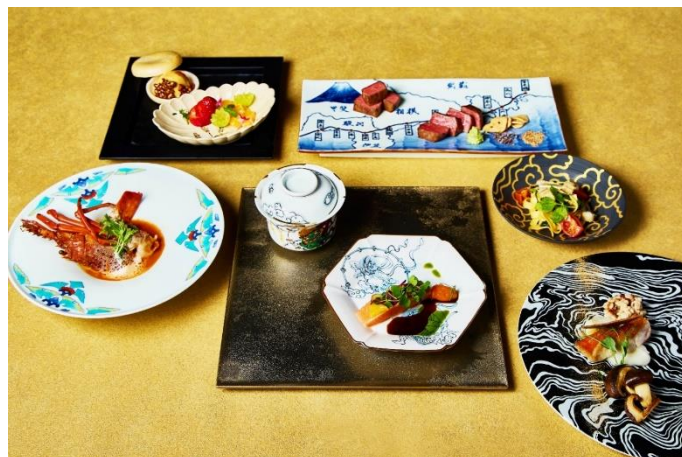
岡田美術館学芸員監修の料理説明で味わうグリルコースは、箱根・強羅 佳ら久が本企画の為に有田から取り寄せた和の器をご用意。