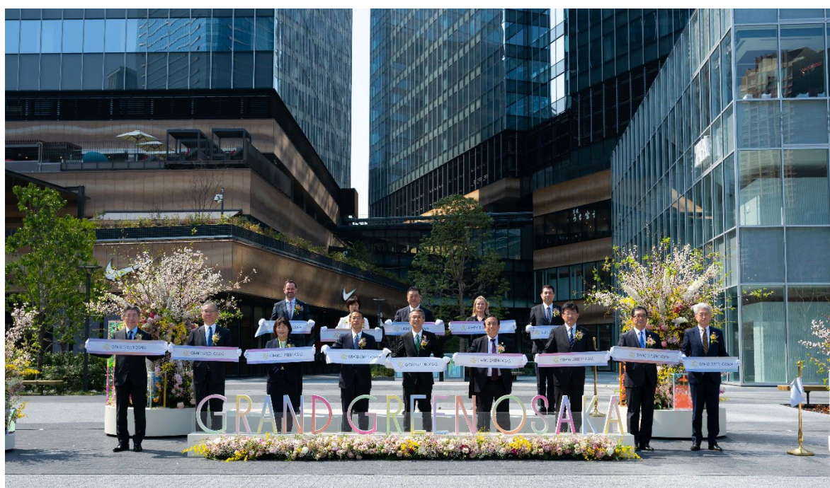
▲グラングリーン大阪 南館 オープニングセレモニーの様子

今後も、「“Osaka MIDORI LIFE”の創造」～「みどり」と「イノベーション」の融合～を計画コンセプトに、まちを訪れる方々やMIDORIパートナー *4 、各施設との連携等を通じて魅力ある価値体験を提供し、ここグラングリーン大阪から、世界に魅力を発信してまいります。