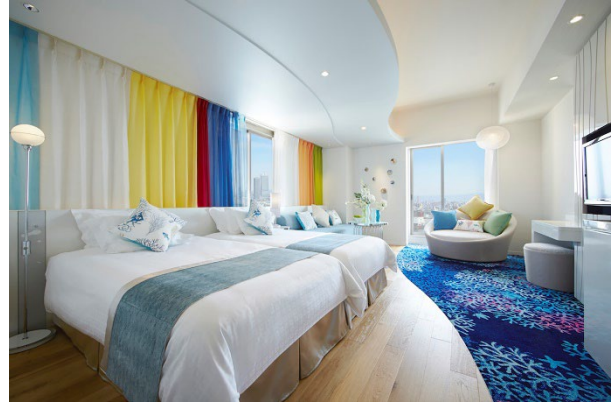
ホテル ユニバーサル ポート