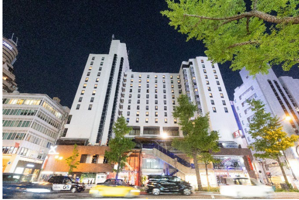
クロスホテル大阪