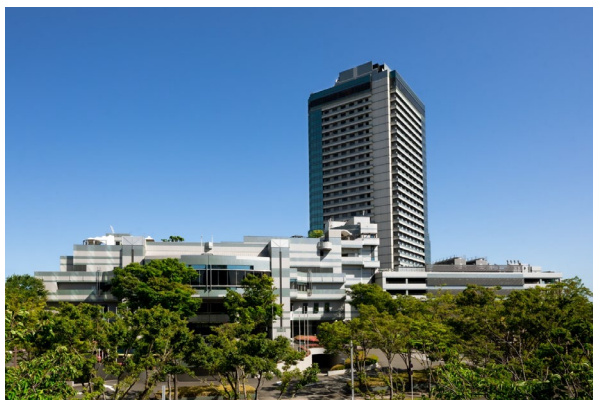
グランドプリンスホテル大阪ベイ