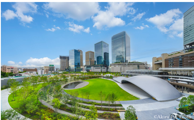
グラングリーン大阪南館からのうめきた公園・北館の景色

グラングリーン大阪開発事業者と一般社団法人うめきた MMO は、3 月 21 日の南館グランドオープンを経てより一層拡大する「みどり」あふれるサステナブルなまち ※4 の整備・管理運営を通じて、我が国のまちづくり GX (Green Transformation) ※5 の推進に貢献してまいります。