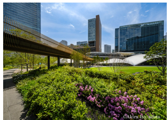
サウスパーク色彩ガーデン周辺の植栽