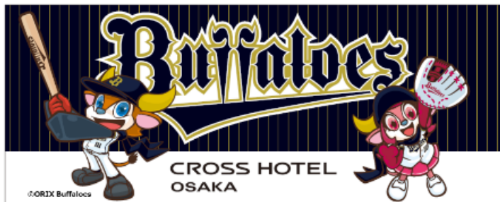
オリックス・バファローズ×クロスホテル大阪 オリジナル応援タオル イメージ