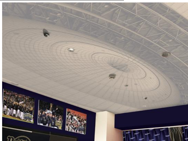
Bs ROOM 2025 イメージ

客室の扉にはオリックス・バファローズのロゴが施され、入室すると人口芝を敷き詰めた床が広がります。左には選手のサインがデザインされたウォールシート、右には躍動感あふれる選手が配置されたデザインシートがお出迎えします。ヒーローインタビューパネル風のウォールシートの奥には選手のロッカールームをイメージしたクローゼットや選手が座るベンチを模した椅子などが設置され、選手気分も味わえるデザインとなっています。ベッドボード上部には2021年から2023年にかけてのリーグ三連覇時のパネルと、2022年の日本一の胴上げパネルを展示しています。喜びと興奮が思い出されるシーンをご覧いただけ、スクリプトマークデザインのカーテンや、ボールとバットのデザインテーブルなど「バファローズ愛」が詰まった客室でのホテルステイを楽しめます。また、サードユニフォームを模したオリジナル応援タオルもご用意しました。