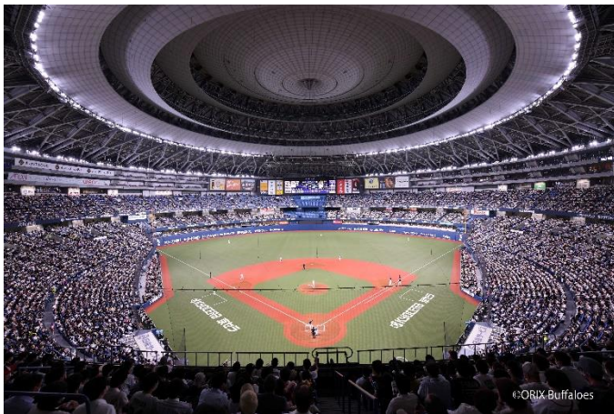
京セラドーム大阪 イメージ

予約方法：公式ウェブサイト http://www.crosshotel.com/osaka/ TEL.06-6213-8281（代表）