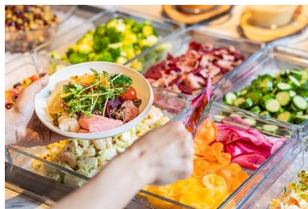
朝食ビュッフェ イメージ