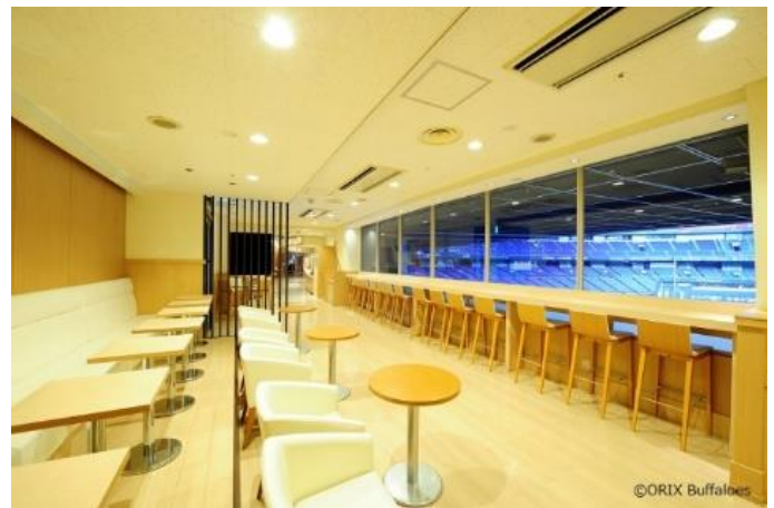
サッポロスターラウンジ イメージ