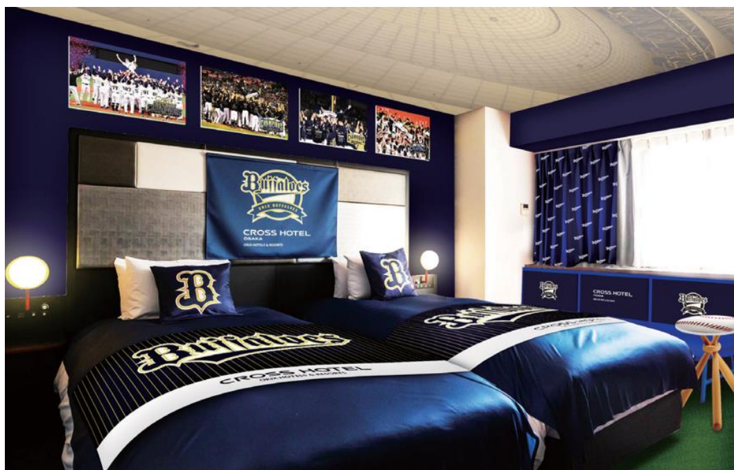
Bs ROOM 2025 イメージ

クロスホテル大阪（所在地：大阪市中央区、総支配人：水谷 之則）は、オリックス・バッファローズコラボルーム「Bs ROOM 2025」を2025年3月28日（金）にオープンします。また、本拠地京セラドーム大阪スーパーエグゼクティブシートでの観戦チケットがセットになった宿泊プランを、本日よりホテル公式ウェブサイト（ https://www.crosshotel.com/osaka/ ）にて販売を開始します。