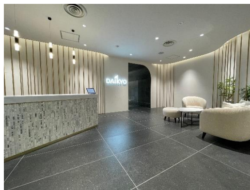
番町レジデンスサロン

近年、首都圏の新築分譲マンション市場は、建築コストや土地価格の高騰により取引価格が上昇し、供給戸数が減少傾向にあります。一方、中古マンション市場は、新築分譲マンションの高騰や不動産投資の活況などから、都心3区（千代田区、港区、中央区）においても高額物件の取引が活発化しています。また、当社が2021年10月に港区で開設した「麻布レジデンスサロン」では、引き続き多くのお客さまにご利用いただいております。このたび新たな高額物件仲介店舗の開設に至りました。