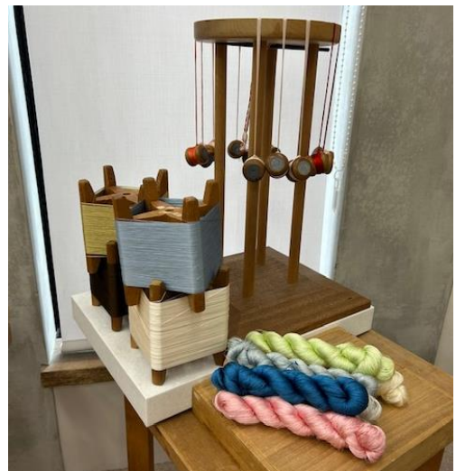
ロビー展示 ※イメージ