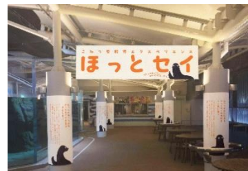
「ほっとセイ」エリアイメージ

オットセイ担当の飼育スタッフが日頃のコミュニケーションやトレーニングを行う中で感じた“ほっとする”エピソードをエリア内の柱の装飾パネルで紹介しします。さらに、個体ごとの見てほしいポイントや愛らしい一面、飼育する過程で遭遇したアクシデントなど約50個のトピックスを大型パネルで紹介しします。