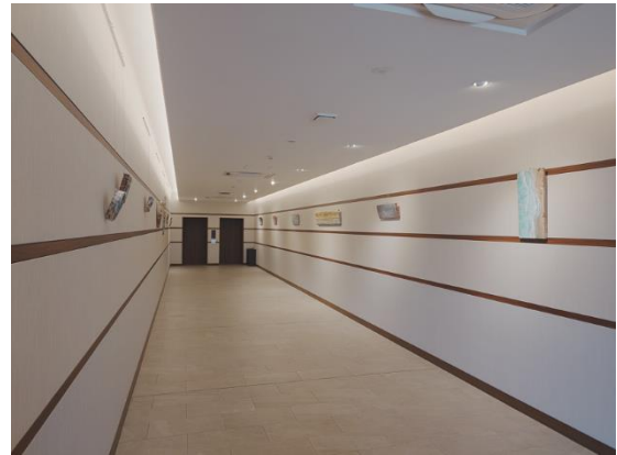
アートギャラリー 一例

「別府温泉 杉乃井ホテル」のコミュニケーションコンセプトは「君としあわせ。」大切な人と過ごすかけがえない時間と、心からの笑顔に包まれる喜び。そんな一瞬一瞬が積み重なり、特別な思い出となるようなリゾート体験をお届けしてまいります。