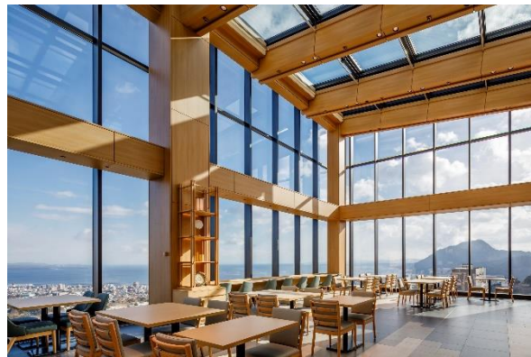
「和ダイニング星 HOSHI」内一部