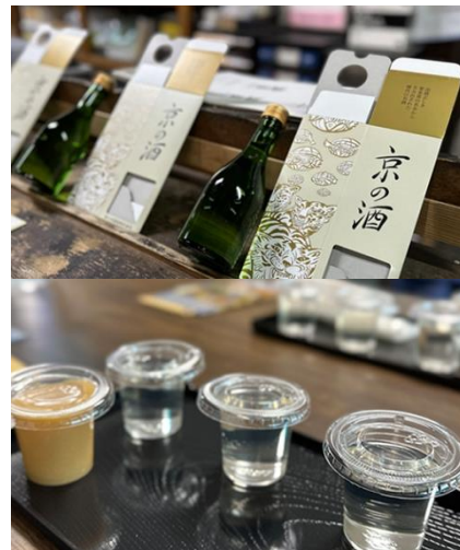
写真上：オリジナルラベルを貼ってお土産に。写真下：なみなみと注がれた3種類の利き酒と、甘酒。