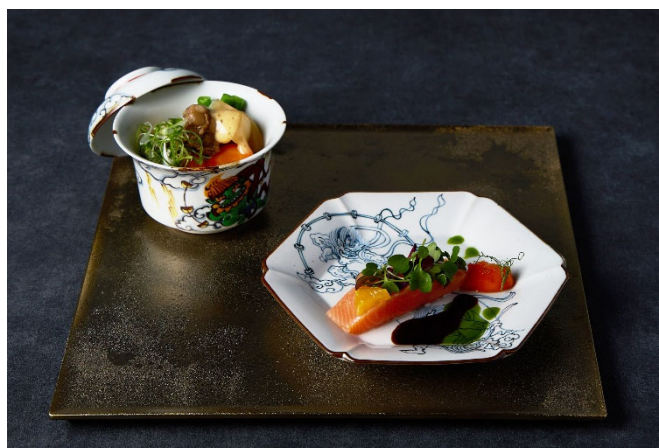
箱根・強羅 佳ら久 グリルコースで味わう岡田美術館の世界観