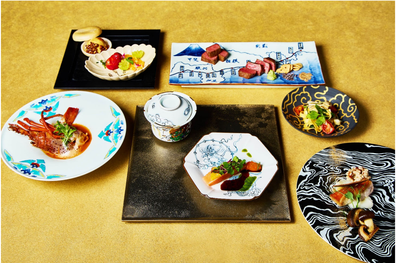
岡田美術館学芸員監修の料理説明とともに味わうグリルコースは、本プランの為に有田から取り寄せた和の器をご用意いたします。

なっております。和の器は日本の文化と言われており、お料理や季節を楽しむといった用途に合わせて使い分けるため、色や形や大きさが様々あるという特徴があります。岡田美術館収蔵の格式高い美術品の写真を鑑賞いただいた後、岡田美術館学芸員の監修の料理説明とともに、悠久の時に思いをはせてグリルコースを味わってみてはいかがでしょうか。箱根・強羅 佳ら久は、日常とかけ離れたつかの間の優雅な時間、「時」と「想い」に寄り添うおもてなし、箱根の風情と本質にこだわった六感で味わう最幸の美食体験を通して、文化の創造、地域の魅力向上に取り組んでまいります。