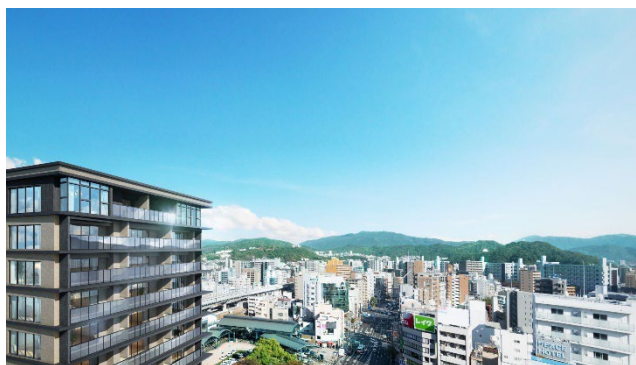
高層階からの眺望（イメージ）

住戸の間取りは、1LDK～3LDK（専有面積45.10㎡～85.04㎡）の全9タイプをご用意します。住戸のある階層に応じて、内装を二つのグレードに分けます。13階以上の高層階からは、広島を中心街を見渡せます。