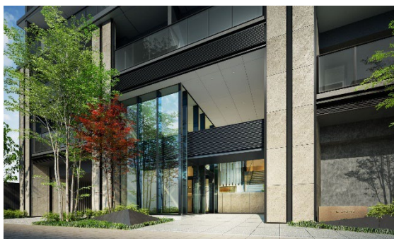
アプローチ（イメージ）

19階の高さを感じさせる垂直方向のラインと各階の庇（ひさし）を左右非対称に据え、エッジを効かせたデザインです。エントランスは2層吹き抜け構造で高さを確保しつつガラスを多用し、開放感のあるラグジュアリーな空間です。デルタ地帯で川に囲まれた地域特性から、「水」を内装デザインの要素に取り入れます。