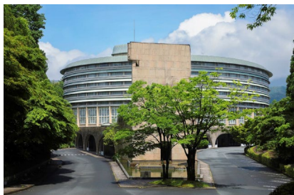
ザ・プリンス 京都宝ヶ池