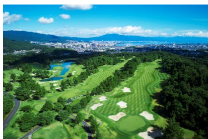
瀬田ゴルフコース