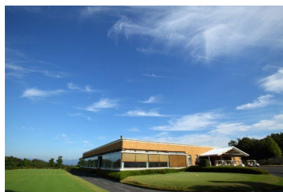
竜王ゴルフコース