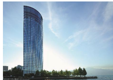
びわ湖大津プリンスホテル