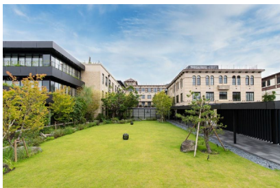
ザ・ホテル青龍 京都清水