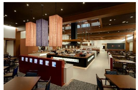
ビュッフェレストラン「あがらんしょ」