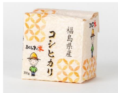
「コシヒカリ」新米2合パック