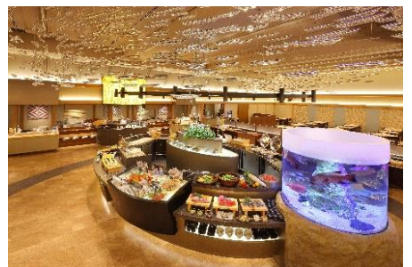
ビュッフェレストラン「シーズ」