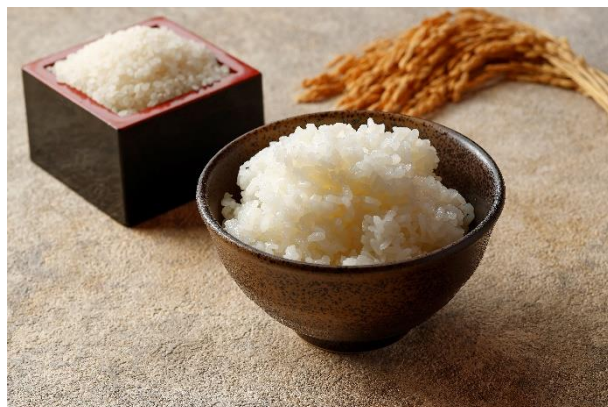
各地域ご当地の新米

旅館コレクションブランドのホテル万惣、御宿 東鳳、やまのはでは、地域一番のうらおいの時間、温泉や地域に根付いた食材を使ったお食事で五感がやすらぎ、心とからだ全体でお客さまがととのう温泉旅館です。