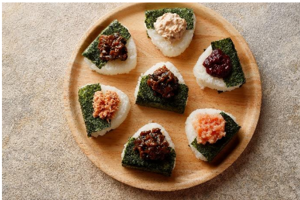
朝食ご当地おにぎり提供（※イメージです）

ORIX HOTELS & RESORTS がお届けする「旅館コレクション」ブランドの「函館・湯の川温泉 ホテル万惣」（北海道函館市、以下 ホテル万惣）、「会津・東山温泉 御宿 東鳳」（福島県会津若松市、以下 御宿 東鳳）、「黒部・宇奈月温泉 やまのは」（富山県黒部市、以下 やまのは）は、各地域の秋の味覚「新米」が楽しめる合同企画第4弾「深まる秋、とれたて新米を味わう旅」を2024年10月31日（木）より開催します。あわせて、本日より宿泊プランの予約受付を開始します。