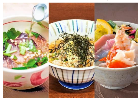
各施設のご当地茶漬け (イメージです)