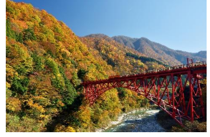
黒部「黒部峡谷トロッコ電車」