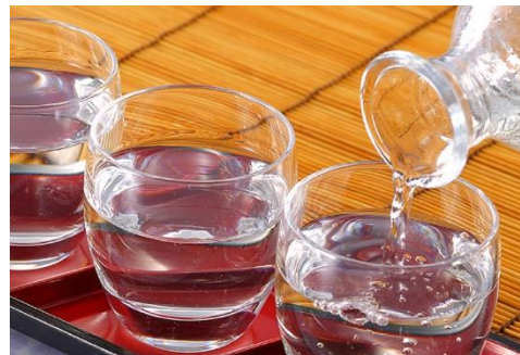
3地域の日本酒飲み比べセット (イメージ)