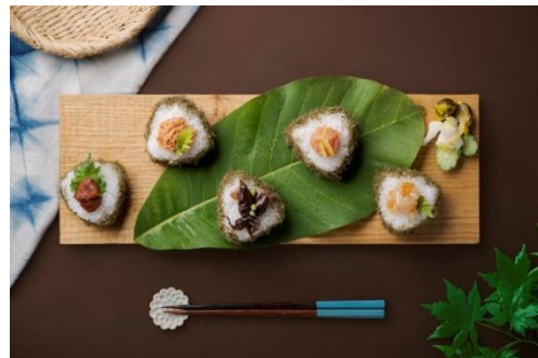
ご当地おにぎり (イメージです)