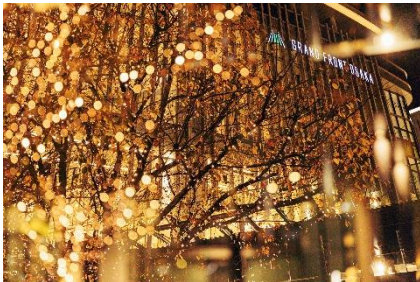
過去実施時の様子

なお、本イベントで使用する電力は、「RE100」※に対応した実質再生可能エネルギー由来となっており(一部エリア除く)、LED 電球も省電力のタイプを採用するなど、環境に配慮したイルミネーションを実現しています。