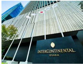
インターコンチネンタルホテル大阪宿泊券