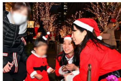
「Grand Santa Parade in UMEKITA」開催イメージ