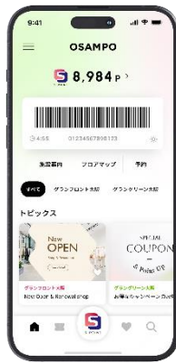
OSAMPO アプリ 画面イメージ