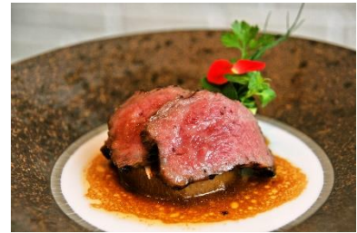
南館 8 階レストラン「チェサビーク」食事券 ※賞品はイメージです。