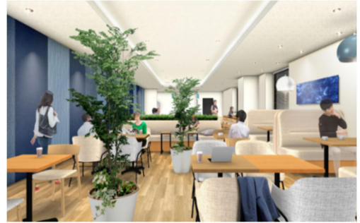
三郷Ⅰカフェラウンジイメージ

三郷Ⅰロジスティクスセンターは、約2,600坪から1フロアを1テナント専有でご利用いただけるため、セキュリティ面において安心です。また、各階に三郷市の伝統である藍染をコンセプトとした専用のカフェラウンジを完備し、従業員の働きやすさにこだわった作りとなっています。なお、各階のカフェラウンジはテナントニーズに合わせ、竣工1年前までにご依頼いただくことにより、無償で応接室・更衣室に変更が可能です。