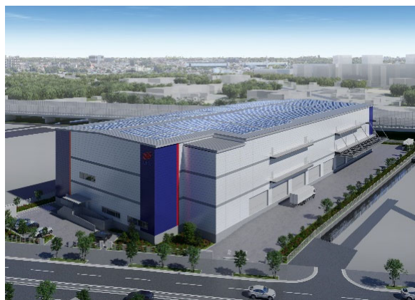
「三郷Ⅱロジスティクスセンター」外観イメージ

三郷Ⅰロジスティクスセンターは、外環道「外環三郷西インターチェンジ（IC）」から約2kmに位置し、東京都心まで1時間以内で配送可能なほか、首都圏エリアへの広域配送にも適しています。建物は4階建て、各階に直接アクセス可能なランプウェイ型で、最大76台の大型車（10t車）が同時接車可能です。最小で1テナント1フロア（約2,600坪）、最大4テナントの入居が可能で、専用のカフェラウンジを各階に完備します。カフェラウンジは、入居企業のニーズに合わせて、竣工1年前までにご依頼いただくことにより無償で応接室・更衣室への変更も可能です。