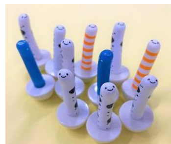
ゆらチン イメージ