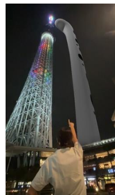
東京スカイツリーと巨大チンアナゴ イメージ