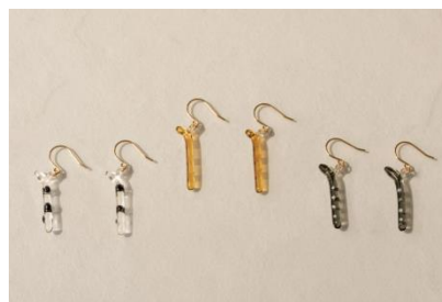
HARIO チンアナゴのガラスアクセサリー