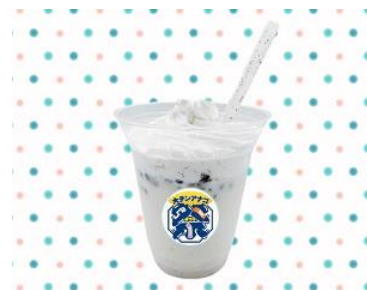
大チンアナゴ祭シェイク イメージ