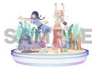
リコリス・リコイル コラボイラスト

「さかな〜」、「チンアナゴ〜」のシーンでおなじみのテレビアニメ「リコリス・リコイル」とのコラボレーションを実施します。「千束（ちさと）」がチンアナゴのポーズをとった描きおろしのイラストを使用したオリジナルグッズなどを販売します。