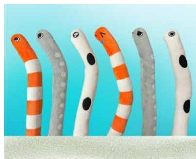
ぬいぐるみ チンアナゴ イメージ

さまざまな表情をしたチンアナゴ、ニシキアナゴ、ホワイトスポッテッドガーデンイールがくねくね曲がるぬいぐるみです。お気に入りの一体を見つけてください。