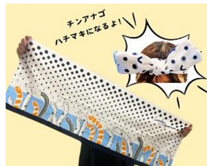
てぬぐい チンアナゴ イメージ

チンアナゴたちが描かれた手ぬぐいです。縦長に折って頭に結ぶとチンアナゴの顔付きのハチマキです。ぜひ身につけて大チンアナゴ祭をお楽しみください。