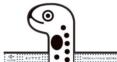
チンアナゴお面 イメージ