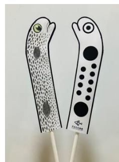
マイチンアナゴ イメージ

チンアナゴ、ニシキアナゴ、ホワイトスポットガーデンイールそれぞれの特徴に注目しながら、チンアナゴ型の紙に色を塗って自分だけの「マイチンアナゴ」を作るワークショップです。完成した「マイチンアナゴ」はぜひ、館内6階に設置された三種のチンアナゴやぐらに飾ってください。