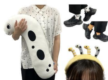
なりきり!ファッション イメージ

館内を回遊しながらお客さまをインスタントカメラで撮影するスタッフが登場します。模様や色などチンアナゴ三種に似ているファッションで来館された方を対象に、インスタントカメラで撮影した「大チンアナゴ祭」ロゴ入りの写真をその場で1枚プレゼントします。