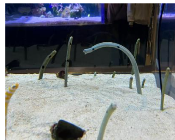
チンアナゴカメラ イメージ