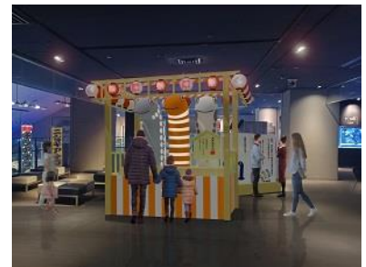
「三種のチンアナゴやぐら」イメージ

「チンアナゴの日」の今後ますますの発展を願い、チンアナゴと同じ水槽で暮らす、ニシキアナゴ、ホワイトスポットテッドガーデンイールをモチーフにしたやぐらです。やぐらには、皆さまがワークショップ「マイチンアナゴ」で作ったチンアナゴたちを飾ることができます。皆さまのご協力のもと、「チンアナゴの日」までに1,111匹のチンアナゴで彩ることを目指します。