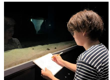
チンアナゴを観察する飼育スタッフ

「チンアナゴの日」が認定されてから今日までの11年間の歩みと、飼育スタッフが行ってきたチンアナゴに関する調査についてわかりやすく展示する屏風風のパネルです。イベント期間中に一緒に調査データを集める調査員を募集するお知らせも掲載します。Xのアカウントをお持ちの方は、皆さまご参加いただけますので、ぜひご注目ください。