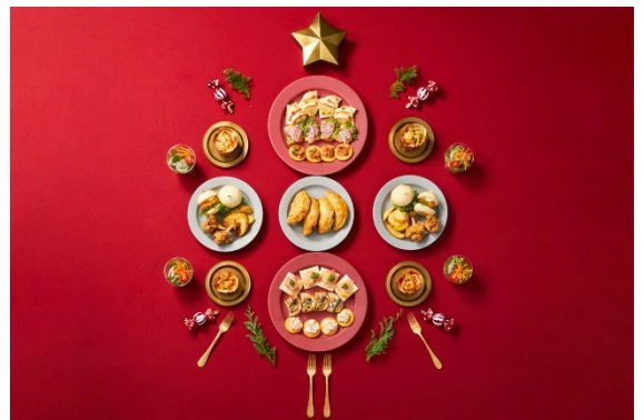
パーティーメニュー （写真はイメージです。料理は4名分。）