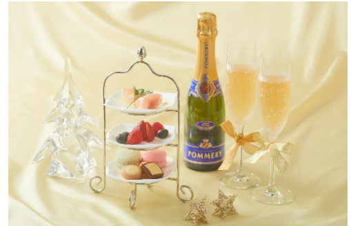
シャンパン&オードブル付き宿泊プラン(イメージ)

【メニュー】オードブル&デザート6種とシャンパン1本(2名利用時はハーフボトル、3～4名利用時はフルボトル)