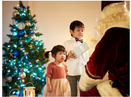
サンタがお部屋にやってくる！(イメージ)

1日17室限定の“サンタに会えるプラン”。ホテル ユニバーサル ポートでは12月21日(土)、ホテル ユニバーサル ポート ヴィータでは22日(日)、24日(火)に、事前にホテルにお預けいただいたクリスマスプレゼントなどを、サンタクロースがお部屋にお届けします。お子さまや恋人など、大好きな人の笑顔に出会える、幸せにあふれるクリスマスをサプライズで演出します。