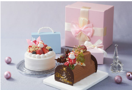
選べる2種のクリスマスケーキ（イメージ）