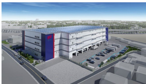
「伊奈ロジスティクスセンター」外観イメージ

オリックス不動産株式会社（本社：東京都港区、社長：深谷 敏成）は、このたび、埼玉県北足立郡伊奈町でマルチテナント型の物流施設「伊奈ロジスティクスセンター」の開発に着手しましたのでお知らせします。