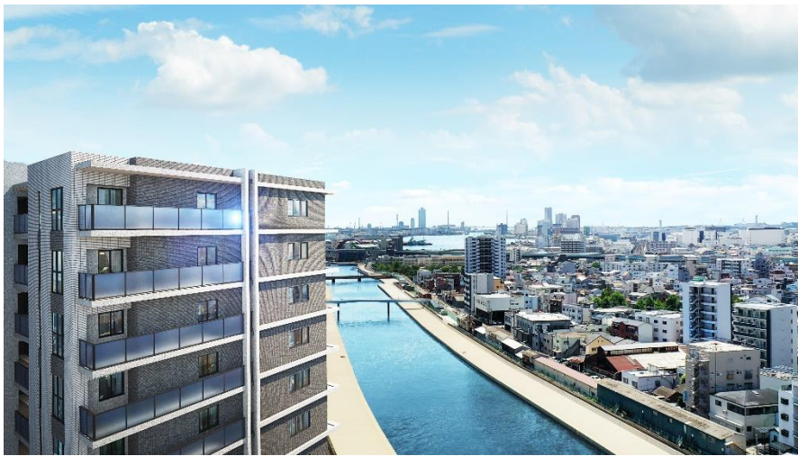
六軒家川に面した立地（イメージ）

敷地は、西側には六軒家川が流れる角地となっているため、通風・採光に優れた開放感のある敷地計画が特長です。六軒家川の川幅は約70m、対岸には戸建て住宅が多く、高い建物が少ないため、高層階は眺望にも優れます。