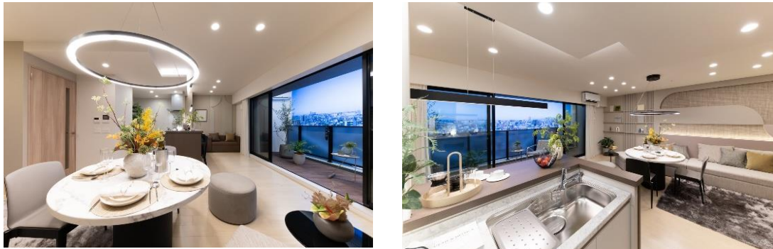
リビングダイニング（モデルルーム）

間取りは、2LDK、2LDK+S、3LDK（専有面積 54.06 m 2 ～71.95 m 2 ）の全 14 タイプをご用意します。大きく窓を開くことができるセンターオープンサッシ、使い勝手の良い L 型キッチン、シューズインクロークなどの設備を採用したプランや、専用庭付き住戸、二面開口の通風採光に優れた角住戸など、さまざまな間取りをそろえます。