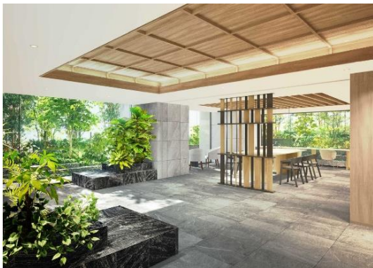
エントランスホール・ラウンジ（イメージ）

敷地全体を緑で包み込むような植栽を計画。在来種を50%以上採用し、敷地面積に対し緑被率20%以上を確保しました。建物外観は、六軒家川の流れと親和性の高い水平のラインを強調したデザインです。1階には、デスクや椅子を設置し、ガラス越しに映る緑が明るいラウンジや、キッチンを併設しパーティーなどにも利用できる集会室を設けました。集会室は中庭にあるガーデンテラスと行き来でき、自然の潤いを一体的に感じられる空間です。