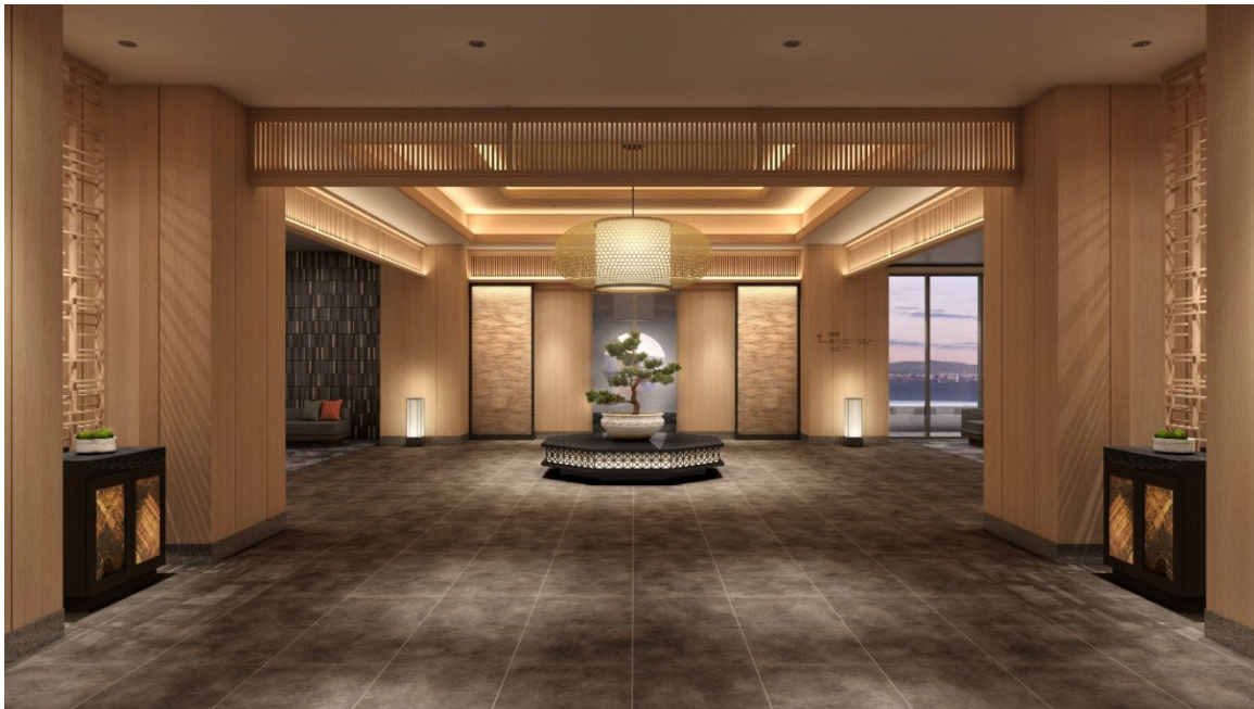
「星館」エントランス イメージ

別府温泉 杉乃井ホテル： https://suginoi.orixhotelsandresorts.com/