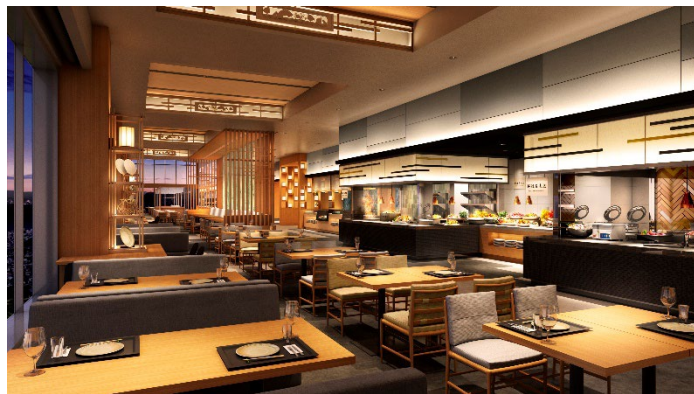
「和ダイニング星 HOSHI」イメージ