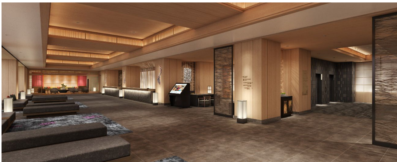
「星館」ロビー イメージ

温泉旅館の懐かしさを感じられる和モダンテイストのロビー。別府湾を望む景色を主役とした1階のロビーには、テラスを設けています。別府市街地を見わたす眺望と別府湾との水面のエッジが一体化した、インフィニティの水盤テラスとなっています。ご滞在中の思い出の1ページにおすすめの場所です。