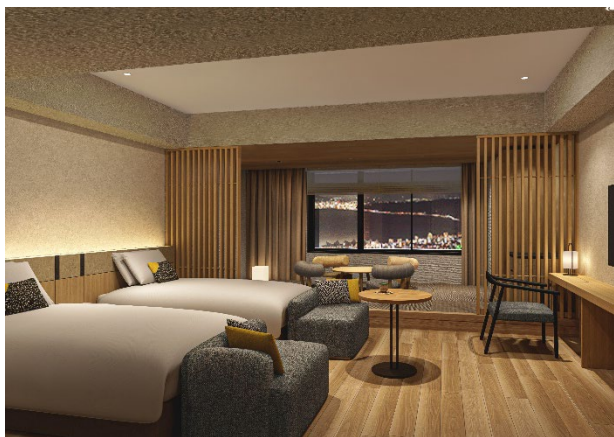
デラックス和洋室（海側）イメージ

温泉旅館の風情を感じていただける、スイートからスタンダードタイプまで5つの部屋タイプをご用意。2名様～6名様までご利用いただけます。客室のカラーコンセプトは「夜半（よわ）」「宵（よい）」「暁（あかつき）」の3つで、夜の始まりの空から深い夜の空、夜明け前の空に浮かぶ星のひかりをイメージしています。棚湯やお食事を堪能した後、大切な人との会話を楽しみながら、くつろぎの時間をお過ごしください。