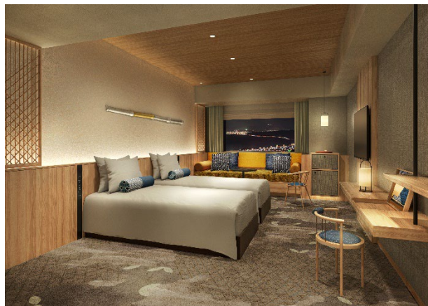
プレミアムスタンダード洋室（海側）イメージ