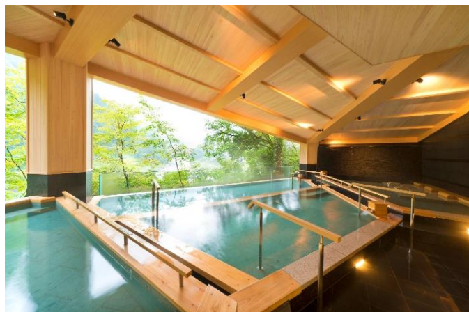
体験後は温泉を楽しむ（写真は棚湯）

宇奈月温泉では昨年、開湯100周年のイベントの一つとして、ヨガ体験を実施しました。お客さまだけでなく、周辺旅館の従業員の方なども多数参加され、宇奈月温泉でのヨガをお楽しみいただきました。