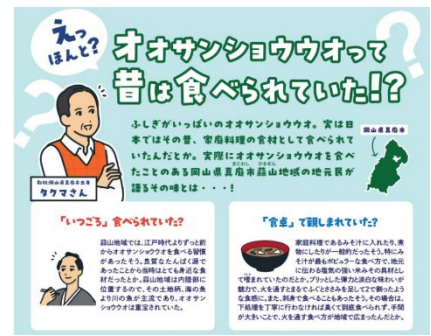
「食べて発見」展示イメージ

現在は、国の特別天然記念物に指定されているオオサンショウウオ（在来種）を食すことはできません。この機会に、かつての食文化の一面に触れてみましょう。