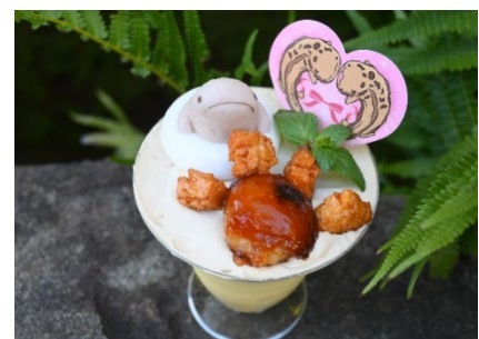
オオサンのおててパフェ