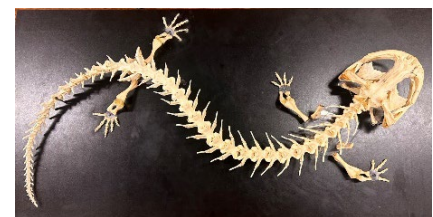
「覗いて発見」展示イメージ

オオサンショウウオを骨の髄までじっくりと観察することができる骨格標本を展示します。ルーペで拡大すると、骨の細部まで観察することができます。「触れて発見」でオオサンショウウオの触り心地を体感した後は、骨格標本で体の仕組みをじっくりとご覧ください。