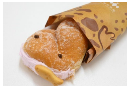
パクっとオオサンショウウオパン