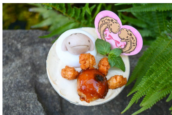
オオサンのおててパフェ

本イベントは、9月9日の「オオサンショウウオの日 ※1 」を記念し、当館が開館当初から飼育するオオサンショウウオをもっと深く知り、もっと身近に感じていただきたいとの思いから開催する体験型企画展です。企画展では、「触覚」「嗅覚」「聴覚」「視覚」「味覚」の五感をテーマにした特別展示を設置し、未だ謎が多く“生きた化石”ともいわれるオオサンショウウオの特徴と魅力をお伝えします。