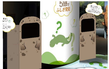
「嗅いで発見」展示イメージ

オオサンショウウオが強い刺激を受けた時に体表から発する特有の匂いを再現したボックスが登場。「鴨川の主、オオサンショウウオ」コーナーで展示中のオオサンショウウオの幼体（交雑個体）の匂いを体験することができます。その香りが山椒の匂いに似ていることが名前の由来という説もあるオオサンショウウオ。実際はどんな匂いなのか、ぜひ体験してください。