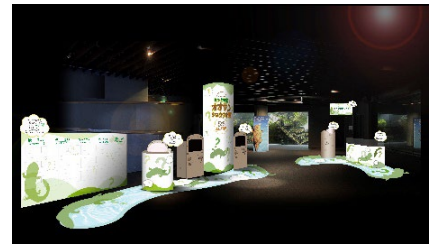
「もっと体感！オオサンショウウオ展」 展示イメージ