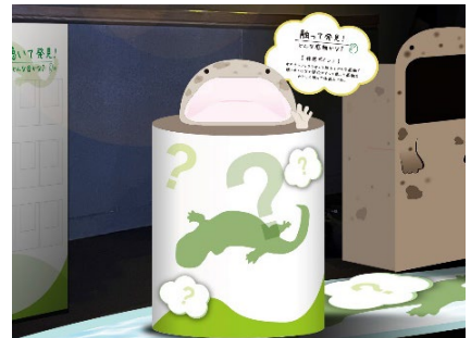
「触れて発見」展示イメージ

オオサンショウウオの頭部と前あしの模型で、触り心地を体感いただけます。在来種のオオサンショウウオの特徴の一つである顔周りのイボをはじめ、白い口の中や前あしの触り心地を飼育スタッフへのインタビューをもとに再現しました。普段は触ることができないオオサンショウウオの手触りを体験してください。