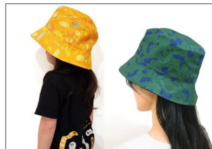
リバーシブルオオサンショウウオハット 左：子ども/右：大人