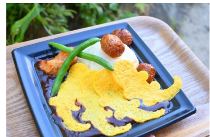
オオサンまみれのオムハヤシ