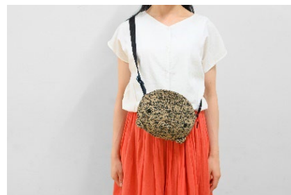
オオサンショウウオポシェット