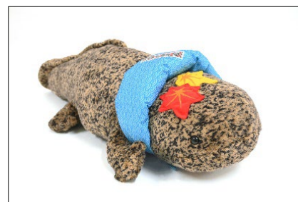
オオサンショウウオ紅葉 Ver.