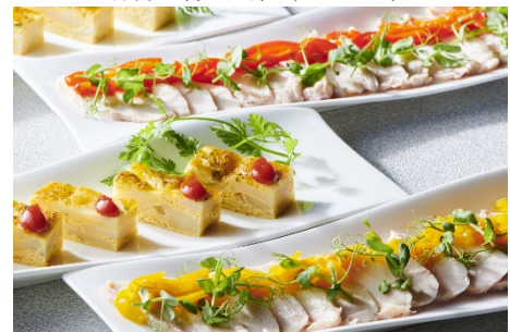
赤井川村産パプリカを使った朝食 （イメージ）