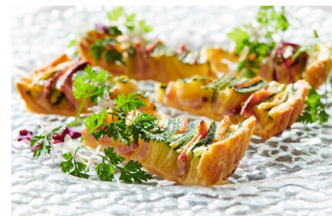
赤井川村産のズッキーニを使ったランチ （イメージ）