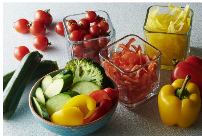
赤井川村産野菜（イメージ）

クロスホテル札幌では「地域共創」活動として、北海道の魅力を発信する事業を行っております。今回は札幌市から車で約90分の赤井川村とタイアップをし、村の魅力を伝えるフェアを開催します。赤井川村は火山活動によってできた大きな凹地※、カルデラ盆地が特徴で、盆地特有の内陸型気候や湿潤な自然条件で、果菜類のおいしさを育んでいます。また、NPO法人「日本で最も美しい村」連合に発足時から加盟し、地域に誇りを持ち、美しさと地域資源を村の内外に広めています。