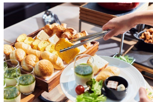
朝食ビュッフェ（イメージ）