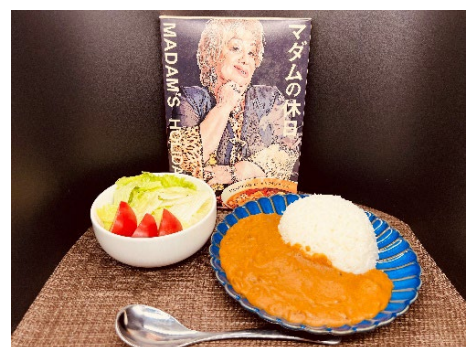
物販商品のカレー「マダムの休日」

「道の駅 あかいがわ」で人気の特産品を2Fロビーで販売。カボチャを使ったレトルトカレーや、ジャムやジュースなどおみやげにも喜ばれる商品を中心に販売いたします。