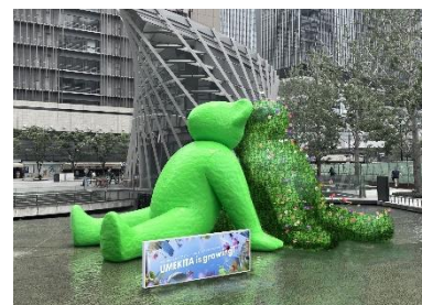
▲「テッド・イベール」特別装飾 イメージ画像

<期間>8月7日（水）～9月16日（月・祝） <場所>グランフロント大阪うめきた広場 水景内