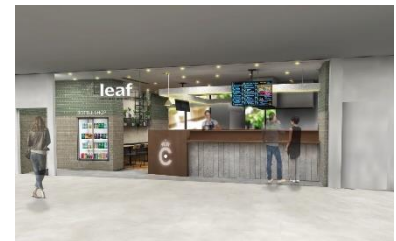
CRAFT BEER BASE leaf