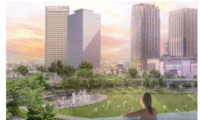
うめきた温泉 蓮 Wellbeing Park