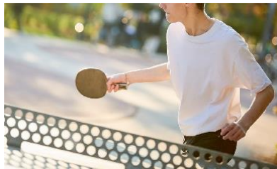
みちあそび/みちスポーツ