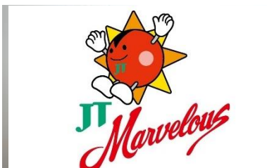
うめきた矯正歯科