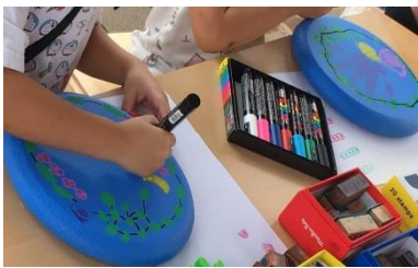
ポーネルド プレイキューブ