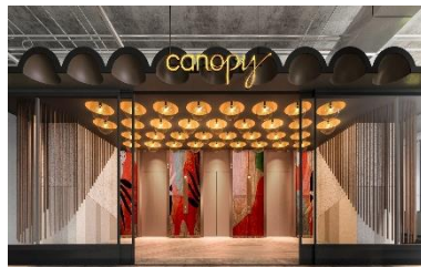
キャノピーby ヒルトン大阪梅田