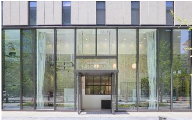
GREEN DOG SALON ILOR