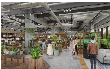
うめきた温泉 蓮 Wellbeing Park