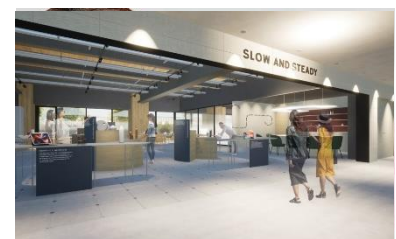
えびの SLOW AND STEADY 院