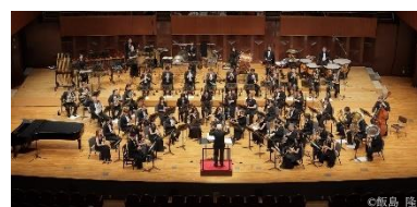
▲Osaka Shion Wind Orchestra