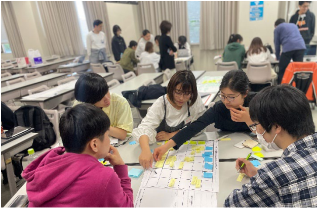
2023年産学連携プログラム実施の様子

第1弾として、今秋就航を目指す、大分空港と大分市を洋上で結ぶ超高速船「ホーバークラフト」を題材に、学生が企業とともに観光産業を学びながら、船内などで上映する映像を製作します。