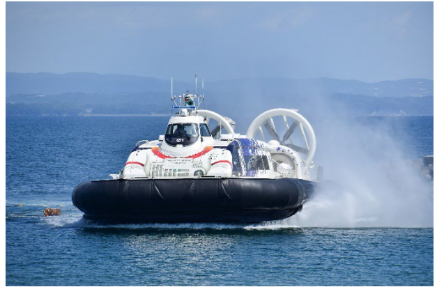
ホーバークラフト

オリックス不動産とAPU、杉乃井ホテル&リゾートは、2021年12月に、「友好交流に関する協定」を締結 ※1 しました。将来の観光産業を担う人材の育成と地域活性化を目的に、学生がオリックスグループのもつ経営ノウハウなどを学びながら、地域の新しい観光資源を創出する取り組みを推進しています。2022年と2023年は、実践型学習プログラムとして、「別府温泉 杉乃井ホテル」でのイベントの企画構築・運営までを学生が一貫して行う、異文化体験イベント「Multi Cultural Festival」を開催しました。