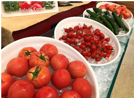
会津産「まるごと新鮮野菜」の提供