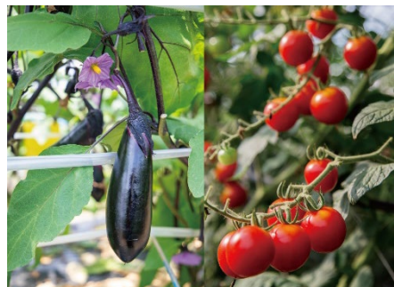
地元生産者が栽培している野菜（一例）

本企画は、7月27日(土)～8月12日(月)の間、JA 会津よつば直売所「まんま～じゃ」で豊富な品揃えのある採れたての新鮮な野菜を、東鳳ロビーの「会津産新鮮野菜市」コーナーでも販売するものです。