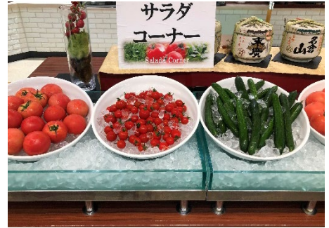
会津産「まるごと新鮮野菜」の提供