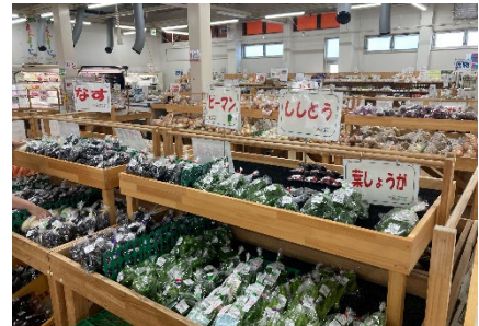
直売所「まんま〜じゃ」店内

公式ウェブサイト https://aizuyotuba.jp/manma-ja/#shop