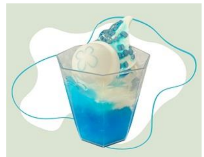
パチッとクラゲブルーサンデー

「ビッグシャーレ」に浮かぶミズクラゲをイメージしたサンデーです。パイナップル果汁を使用したクラッシュゼリーに、塩バニラソフト、ブルーハワイシロップ、ミズクラゲ型のマシュマロをトッピング。さらに、クラゲのトゲを、パチッとほじけるチョコレートで表現しました。