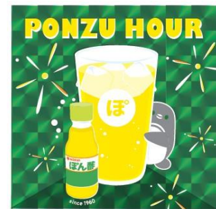
オリジナルコラボステッカー （イメージ）

マゼランペンギン「ぼんず」の誕生を記念し、昨夏開催した企画が、1年ぶりにパワーアップして復活します。期間中、毎日午後4時以降にぼん酢の酸っぱさがクセになる「ぼん酢入りドリンク」1杯とフードメニュー1品のセットをご購入いただいたお客さまに、オリジナルコラボステッカーをプレゼントします。ステッカーのイラストは、換羽 ※2 を経て成鳥になった「ぼんず」をイメージしています。ドリンクとフードを楽しみながら、「ぼんず」や、同じ年に生まれた「こうめ」「あめ」「ずんだ」の成長を一緒にお祝いしてください。成鳥姿の4羽は、タイミングが合えばペンギンプールで観察できるかもしれません。