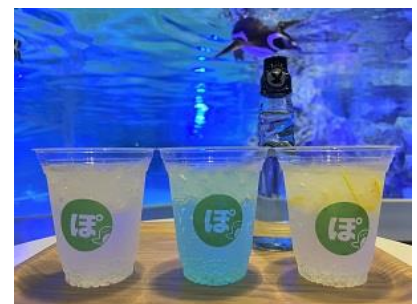
ぼん酢ドリンク3種