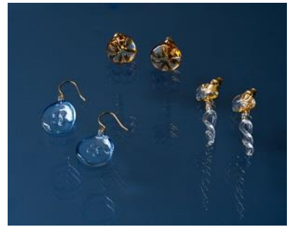
HARIO クラゲのガラスアクセサリー （イメージ）

HARIO Lampwork Factory URL : https://www.harrio-lwf.com