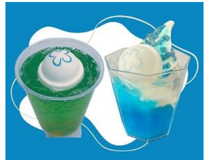
選べるクラゲスイーツ 2種