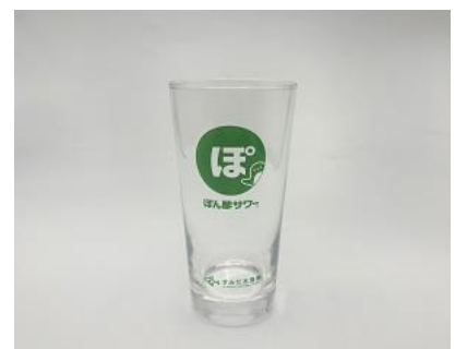
オリジナルぼん酢サワーグラス