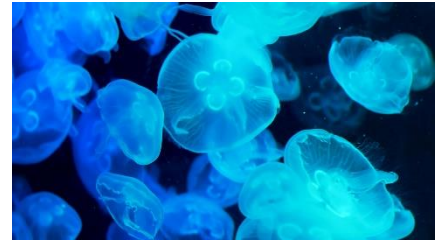
ビッグシャーレ（イメージ）

すみだ水族館のクラゲの映像を使用したプロジェクションマッピングによって視界いっぱいにクラゲの世界が広がり、まるで海の中にいるような没入感が得られます。映像には、クラゲの拍動に合わせるかのように打ち上がる花火も加わり、約500匹のミズクラゲが漂う水盤型水槽「ビッグシャーレ」との美しいコラボレーションをお楽しみいただけます。