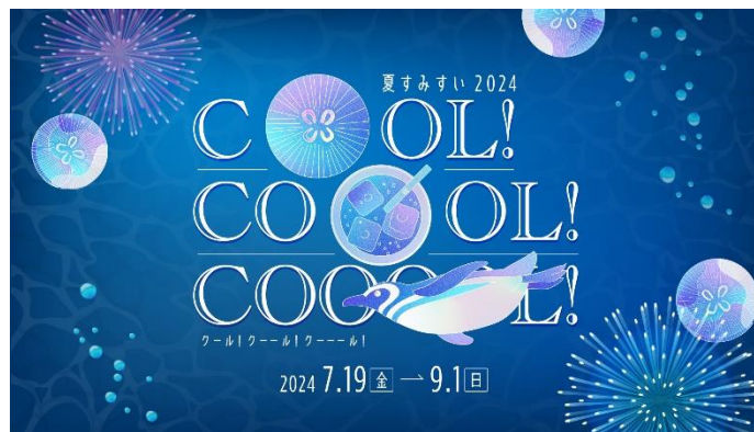
「Cool! Cool! Cooool!」キービジュアル