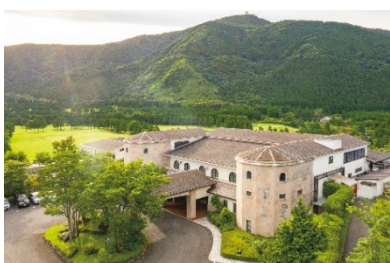
箱根仙石原プリンスホテル