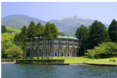
ザ・プリンス 箱根芦ノ湖