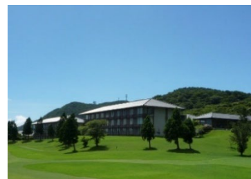
箱根湯の花プリンスホテル