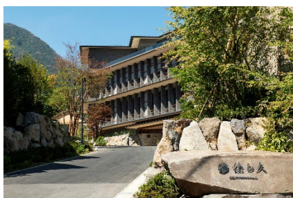
箱根・強羅 佳ら久