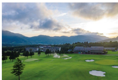
大箱根カントリークラブ