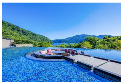
箱根・芦ノ湖 はなをり