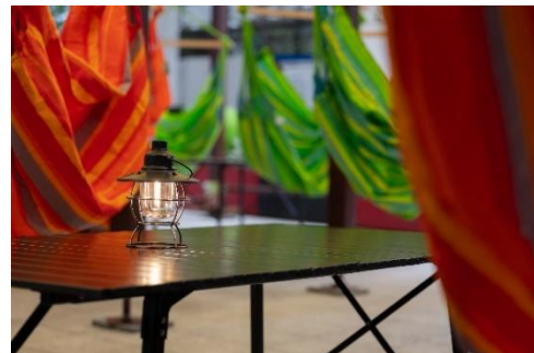
卓上ライトでキャンプ気分 （イメージ）