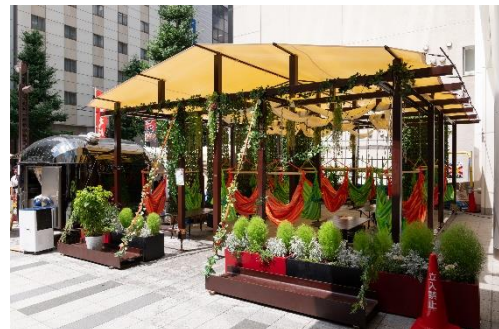
都心に出現するハンモックテント