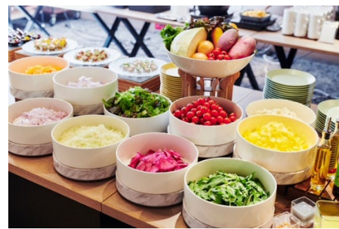
ビュッフェのサラダコーナー（イメージ）