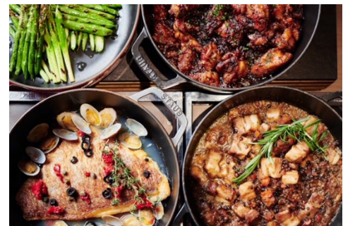
チキン・ポークなども提供（イメージ）