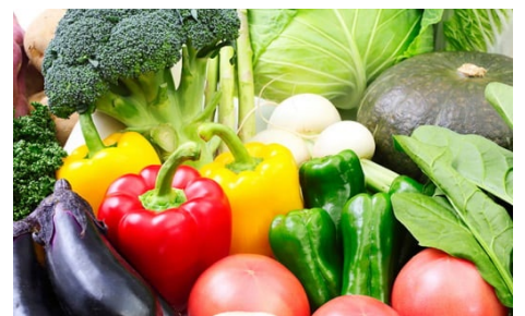
人気のお礼の品「旬のおまかせ野菜詰合せ」 （イメージ）