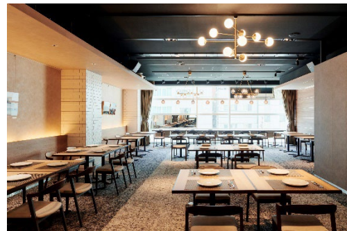
改装したレストラン店内