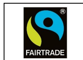
国際フェアトレード 認証ラベル

https://www.fairtrade-jp.org/about_fairtrade/