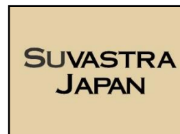
株式会社スバストラジャパン

株式会社スバストラジャパンは、アパレル製品や雑貨を中心に、フェアトレード商品の企画、生産、販売を行う企業。同社のインドにおける協力会社 Suvastra India 社との深い連携により、インド産のフェアトレード認証コットンを使用した製品を主に扱っています。