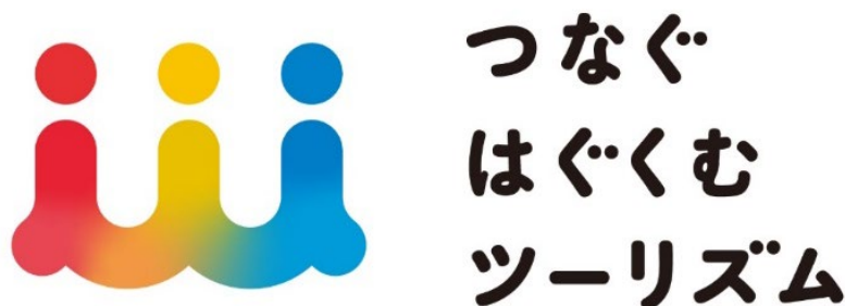
「つなぐはぐくむツーリズム」プロジェクトロゴ

「つなぐはぐくむツーリズム」は、当社直営の旅館・ホテル、研修施設全 22 施設を対象に、SDGs の中で特に観光が主要テーマとされている「働きがいも経済成長も」「つくる責任つかう責任」「海の豊かさを守ろう」の三つの目標の達成につながる体験を宿泊プランやお食事、展示などのさまざまな形で提供します。地域の観光や施設での滞在を通して、「サステナブルな観光」につながるアクションを楽しみながら体験していただきます。そこで得た“気づき”が、旅行が終わり日常に戻ってからも、普段の意識や行動に少しでも変化を与えられるようなインパクトのひとつへと育まれていくことを目指しています。