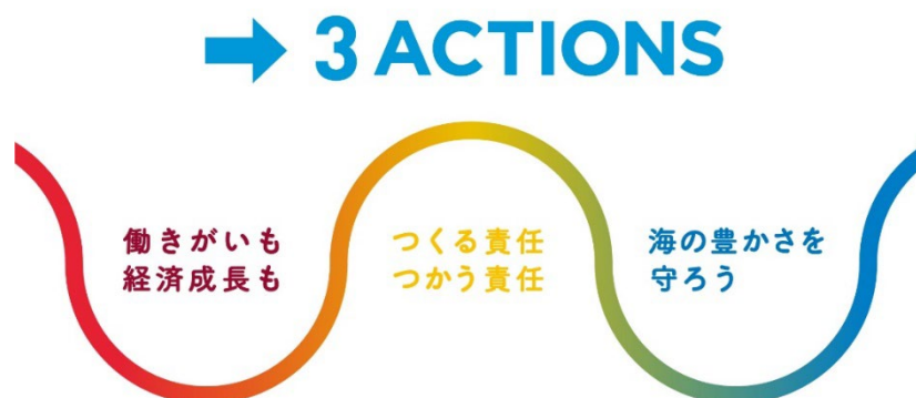
つなぐはぐくむツーリズムプロジェクト 三つの重点目標イメージ

「つなぐはぐくむツーリズム」では、SDGs の中で観光が主要テーマとされている、目標 8「働きがいも経済成長も」・目標 12「つくる責任つかう責任」・目標 14「海の豊かさを守ろう」の三つを重点目標に設定し、この目標の達成につながるアクションに触れる機会を提供します。