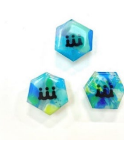
プロジェクトバッジ イメージ

〈バッジ制作協力〉 カエルデザイン https://kaerudesign.net/