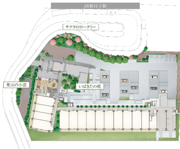
敷地配置図 (イメージ)

駅前の立地でありながら空地率 60%、緑化率 20%以上を確保し、ゆとりある緑地帯を形成することで緑に包まれた暮らしを実現します。敷地内には、在来種を中心とした植栽（高・中木約 280 本、低木約 7,800 株、地被植物約 12,000 株）を行うとともに、周辺の緑地や街の緑をつなぐ植物（サクラやクスノキなど植樹）や生物の中継地（里山の小道ゾーンを設置）としての役割を果たすことで、地域との共生と地域の生態系の保全を目指します。