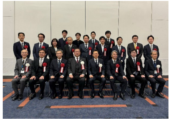
おおさか環境にやさしい建築賞 受賞式