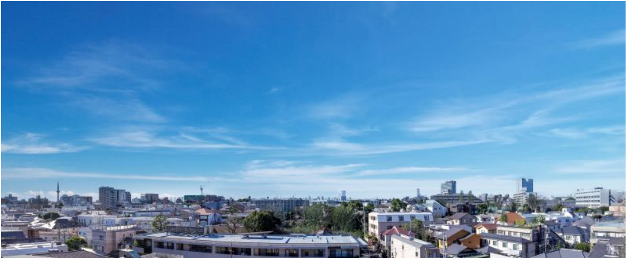
3階からの西側眺望イメージ

「リジェ代々木上原テラス」は、小田急小田原線・東京メトロ千代田線「代々木上原」駅徒歩5分の立地で、高さ制限10mの「第一種低層住居専用地域」に位置します。周辺は江戸時代より武家屋敷があり、明治時代以降に財界人や官僚向けに開発され、昭和初期には徳川慶喜の孫が所有していたとされる歴史ある土地です。本敷地の西側一帯が低いいため、閑静な住宅街を見渡す眺望や豊かな光と風を感じる開放感を享受できます。敷地面積の最低限度が200㎡という渋谷区の土地利用調整条例により、周辺はゆとりある街並みが広がっています。