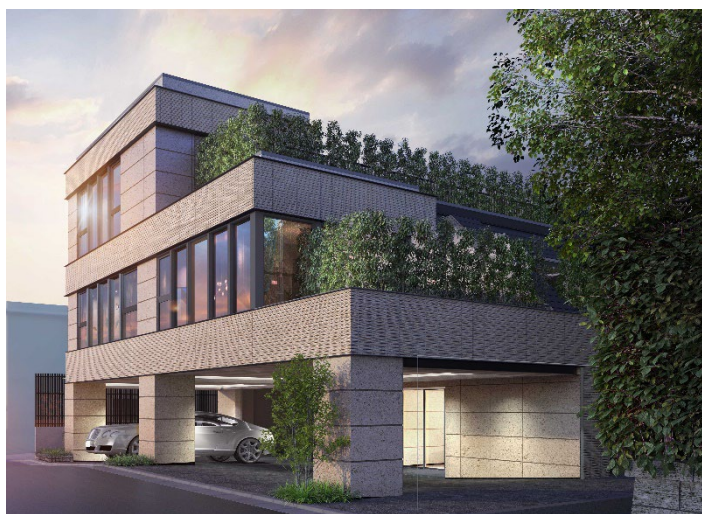
リジェ代々木上原テラス 外観イメージ

株式会社大京（本社：東京都渋谷区、社長：深谷 敏成）は、東京都渋谷区で開発中の分譲マンション「リジェ代々木上原テラス」（地上3階、地下2階建て、総戸数12戸）のエントリー受付を、本日より開始し、あわせて公式ウェブサイト（URL： https://lions-mansion.jp/MN210056/ ）を開設しますのでお知らせします。