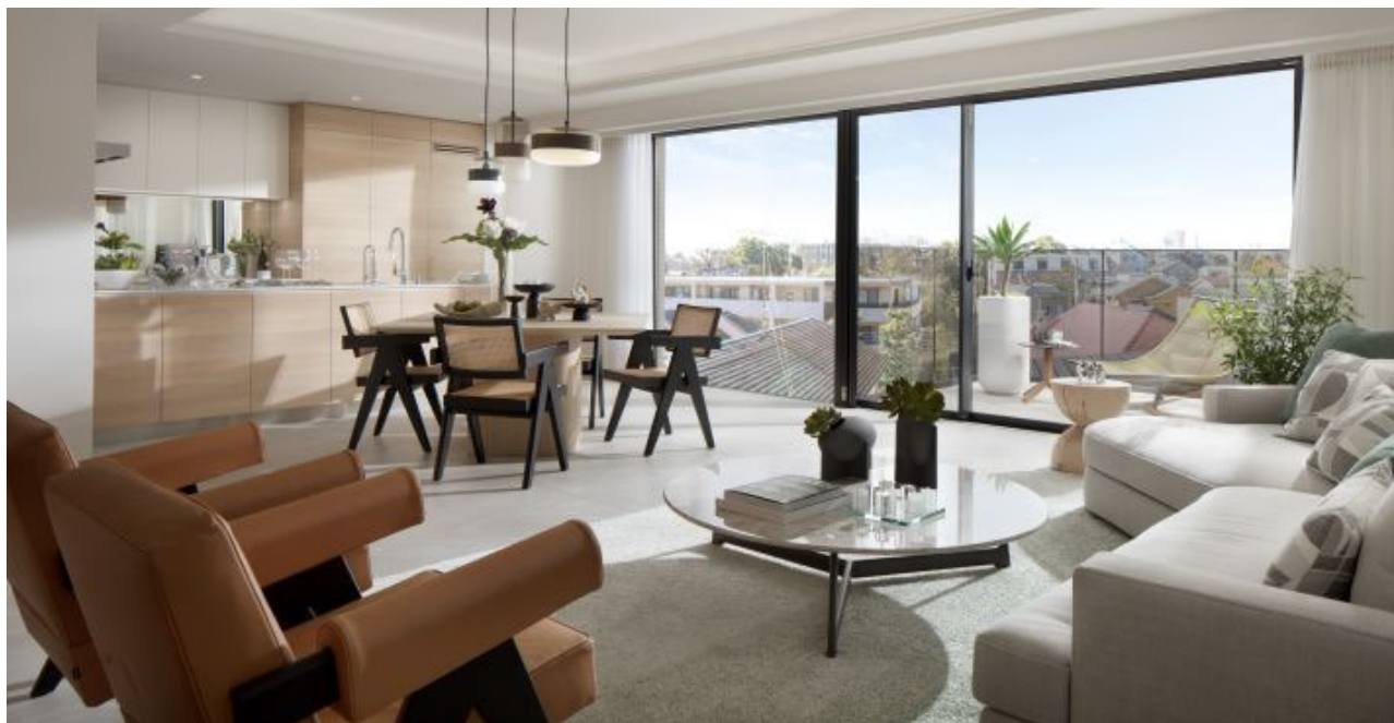
街並みをゆったり望む開放感ある住戸（イメージ）

1,100㎡超の敷地にタイプの異なる全12戸を配置、リビングなど居室の天井高は約2.65m、サッシ高は約2.18mあり、開放感や通風、採光に優れます。街並みを望む西側には広々としたバルコニーを設置します。間取りは、2LDK・3LDK（85.85㎡～214.37㎡）の全12タイプからお選びいただけます。標準で海外製食洗機や大判タイル張りのバスルームを採用するなど、ハイグレードな設備仕様を設けています。