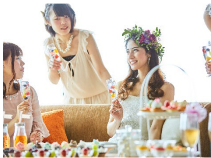
SOAR～ソアラ～での披露宴イメージ