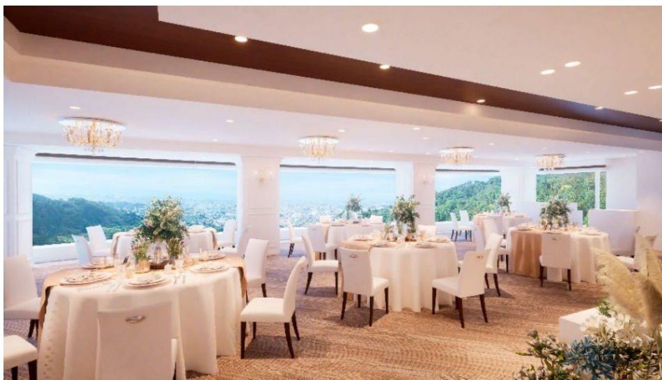
リニューアルパースイメージ (写真はイメージです)

東鳳ウェディング公式ウェブサイト： https://www.toho-wedding.jp/