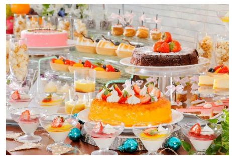
デザートビュッフェ(写真はイメージです)