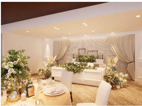
リニューアルパース (写真はイメージです)

リニューアルオープンに伴い、「SOAR～ソアラ～」のご婚礼専用プランを販売します。家族や親しいご友人と肩肘を張らずに心踊るようなひとときが過ごせるように特典としてデザートビュッフェやおもてなしに欠かせないお料理のグレードアップなど3つのオプションより1つプレゼントします。