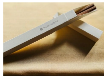
東鳳オリジナル箸「HACOHASHI」

【内容】お料理、お飲み物 30名さま分、音響照明料、 両家控室料、介添料、会場使用料、宴席料 (東鳳オリジナルお箸「HACOHASHI」付き) ご宿泊6名さま分サービス(1泊朝食)、 新郎新婦衣裳1着ずつ、新郎新婦洋装着付代、 ブライズルーム使用料、記念写真、チャペル挙式料