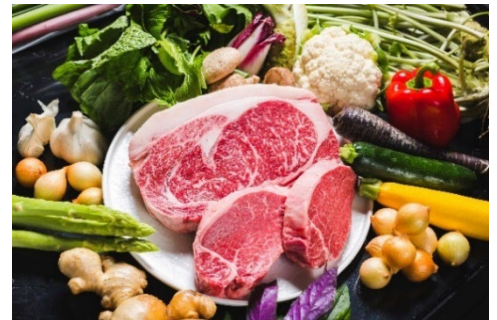
箱根・強羅 佳ら久 ご夕食 お料理素材イメージ