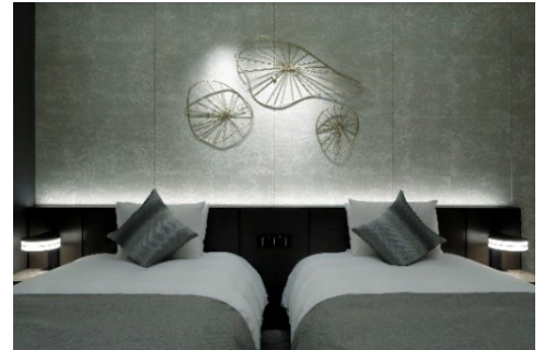
箱根・強羅 佳ら久 佳ら久ルーム 一例