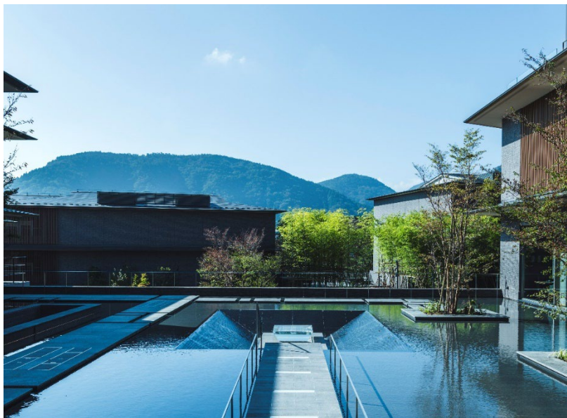
箱根・強羅 佳ら久 水のテラス

12月2日（土）に開業する熱海・伊豆山 佳ら久の宿泊を含むプランを期間限定で販売