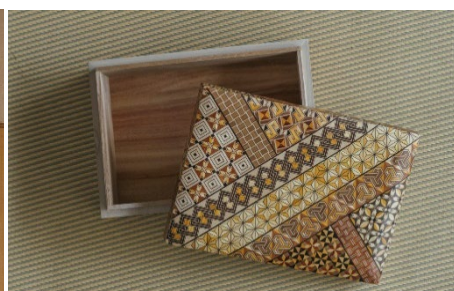
伝統工芸 箱根寄木細工