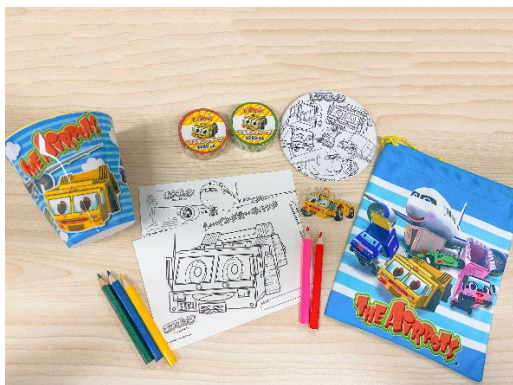
エアポッツグッズ

大きな空港を舞台にした物語「エアポッツ」のグッズが付いているコラボレーションプランです。お部屋で遊べるぬり絵などが付いており、ファミリー利用におすすめの宿泊プランです。