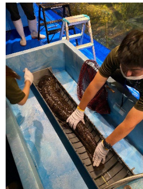
オオサンショウウオ測定の様子 (2022 年撮影)

健康管理のため、年に一度実施する身体測定を間近でご覧いただけます。測定会では、京都水族館で飼育しているオオサンショウウオ約 20 頭のうち、最も大きな個体（交雑個体）の測定を行います。測定の手順をスタッフが解説しながら、日ごろお客さまから多くいただいている質問への回答や飼育スタッフが日頃感じているオオサンショウウオの魅力を解説します。昨年 158cm を記録した最大個体がさらに大きく成長しているのか、体重は変化しているのか、その結果にご期待ください。