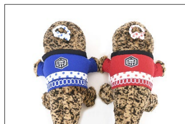
「お祭りオオサンショウウオ」 ぬいぐるみ 青・赤

本イベントは、当館で開館当初から飼育しているオオサンショウウオの生態とその魅力をより多くの方に伝えたいとの思いから、9月9日の「オオサンショウウオの日 ※ 」を地域一体で盛り上げるイベントとして2018年に初開催し、今年で5回目を迎えます。