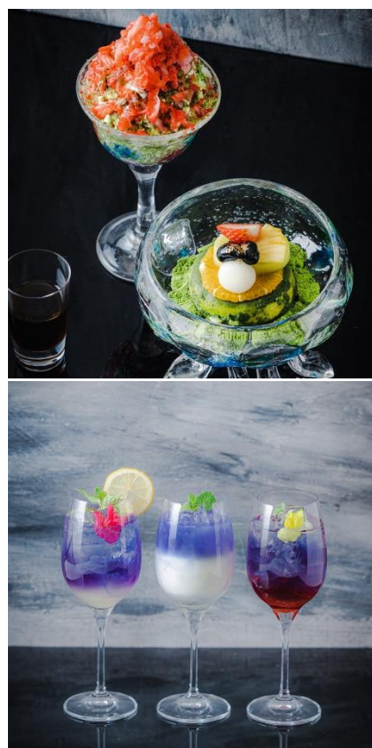
写真上：「冷やし抹茶ブリュレ ～抹茶練乳&苺のシャリシャリフローゼンと」。

[オレンジジュース・アップルジュース・グレープフルーツジュース ジンジャエール・ペプシコーラ]