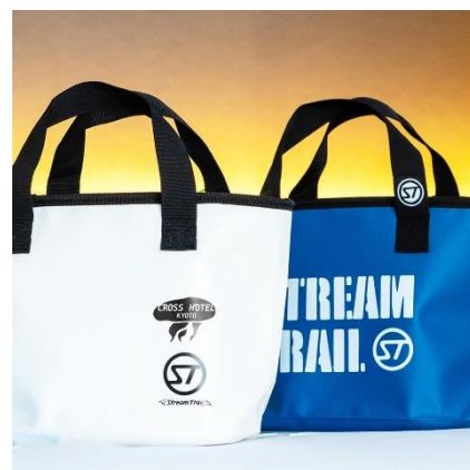
ワンポイントにクラゲイラストが入ったクラゲトートバッグ。

予 約：公式ウェブサイト https://www.crosshotel.com/kyoto/ | TEL 075-231-8833（宿泊予約直通）