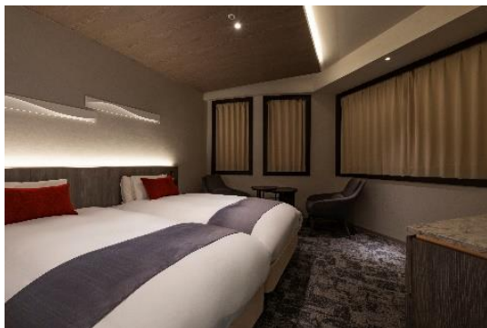
アドバンスフロア/デラックスツインハリウッド

公式ウェブサイト： https://www.haneda.jalcity.co.jp/