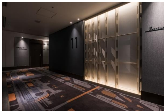
アドバンスフロア/エレベーターホール

2020 年に第一弾として「レギュラーフロア」（6～9 階）の客室改装を行い、このたび、「アドバンスフロア」（10～11 階）と「プライムフロア」（2～5 階）の 6 フロア・176 室のリニューアル工事を実施し、全客室が新しく生まれ変わりました。