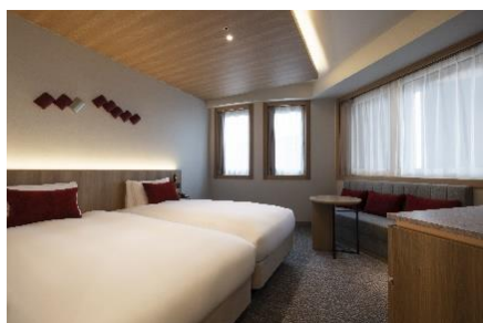
デラックスツインハリウッド