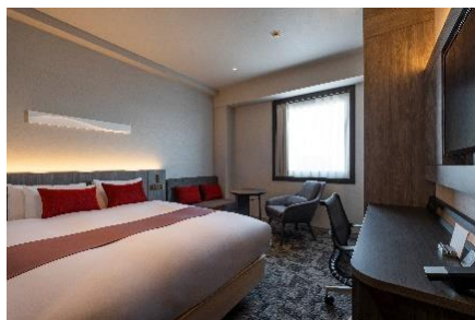
スーパーリアダブル

『深寝する』をテーマに、ゆったりしたベッドと安らぎの灯りで心地よい深い眠りへと導きます。客室のベッドにはエアウィーヴマットレスパッドを採用し、深夜のご到着や早朝のご出発のお客さまにも質の高い睡眠環境をご提案します。