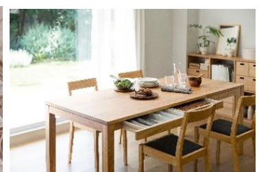
【関西最大店舗】 無印良品/Café & Meal MUJI 秋に店舗拡大オープン予定