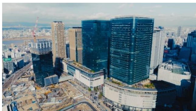
▲まちびらき10周年を迎えるグランフロント大阪

今後、2024年のうめきた2期地区開発事業「グラングリーン大阪」の先行まちびらきや、2025年の「大阪・関西万博」を控え、これまで以上に大阪、そしてうめきたエリアに注目が集まることが予想されます。そのような中、グランフロント大阪は、新ビジョン「創り出そう、ともに。」のもと、これからも多様な人々を巻き込み、進化に挑戦し続けることで、グランフロント大阪のまちの発展、ひいては、うめきたエリア全体のさらなる価値向上を目指してまいります。