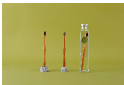
「自然に還る歯ブラシ」turalist