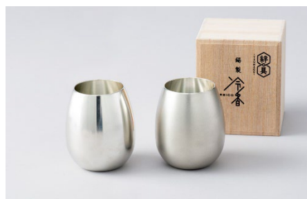
錫製タンブラー 冷香-reico- 磨・白上

本イベントでは、大阪製ブランド認定制度に基づき大阪府知事が認定した「大阪製ブランド製品※1」を期間限定で館内に展示します。昨年に続き第二弾となる今回は、両施設の特徴を生かし、研修所では「想像を超える大阪製」、ホテルでは「エシカルな暮らし体験」をテーマに掲げた展示内容となっています。丁寧な製品づくりから「サステナブル」を考えるきっかけとなったり、優れた技術や社会課題を解決する製品アイデアに着想を得たり。日常生活とは少し離れた旅先や研修中だからこそ、いつもとは違う感性で製品を見て触れていただき、「たった一つのあなただけの出会い」をご提供できればと考えています。