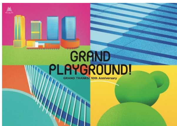
「GRAND PLAYGROUND!」メインビジュアル

まちびらき10周年を迎えるにあたり、そしてこれからの10年間を見据え、この度グランフロント大阪では新ビジョンを策定しました。「創り出そう、ともに。」をスローガンに、これまで以上に多様な人々を巻き込み、進化に挑戦しつづけるまちを目指します。その新ビジョンを来街者の皆さまに体感いただくためのテーマは、「 GRAND GRAND PLAYGROUND! 」。まち全体をグランフロント大阪らしい「 GRAND グラン(壮大) 」な「 PLAYGROUND みんなの遊び場 」にすることで、大人も子どもも自然にまちに集まり、訪れるすべての人がワクワクし、新たな感性と意欲が湧いてくる——「遊ぶ」という主体的な行いを通じて、来街者の皆さまがまちを再発見するきっかけをつくることで、長く愛されつづけるまちを目指します。