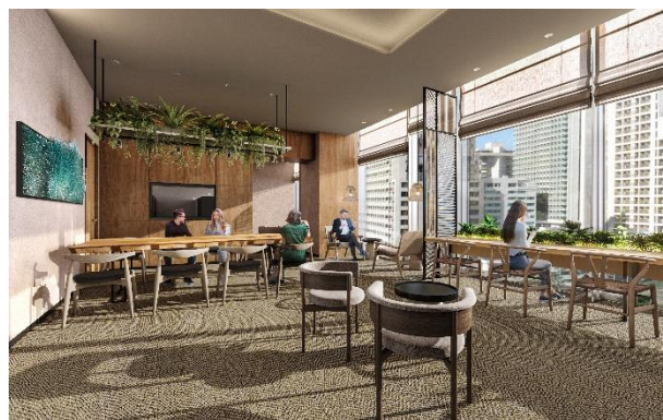
▲宿泊者専用ラウンジ（完成予想イメージ）