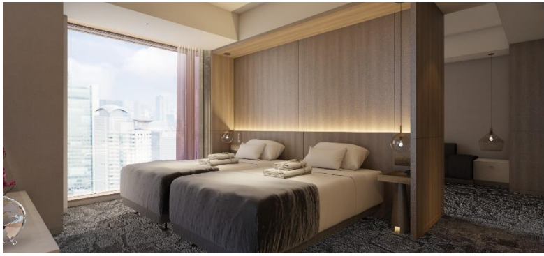
▲客室（完成予想イメージ）

全 482 室の客室は、2 名までのお客さまをおもてなしする構成になっており、自然体でゆったりとした時間を過ごせる“大人が楽しめる空間”を創出しています。