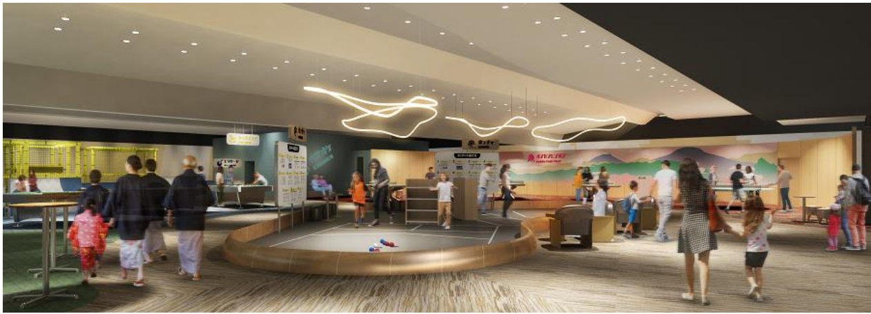
「SUGINOI BOWL &amp; PARK」イメージ

世代を問わずみんなが楽しめるように、近年注目が高まるユニバーサルスポーツとして「ボッチャ」が新たに登場します。また、温泉地の定番「卓球」は、通常の卓球台に加えて円形の卓球台もあり、いつもとは一味違った対戦も可能です。さらに、デジタル映像の的に向けて弾を込めて撃つ「デジタル射的」は、デジタルとアナログの良さを生かしたコンテンツ。これまでも人気の高かった「ボウリング」をはじめ、「ビリヤード」「ダーツ」「カラオケ」、小さなお子さまが遊べる「キッズエリア」もそろい、みんなで“行ってみたい”“やってみたい”と思っただけのような充実のラインアップです。また、軽く体を動かした後や休憩の合間にぴったりの手軽に食べられるフードやアルコール・ソフトドリンクも販売します。