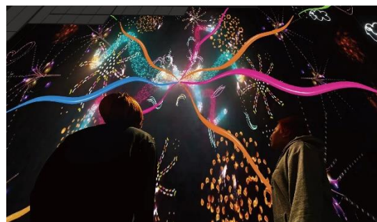
プロジェクションマッピングの世界観

屋内レジャープール「アクアビート」の建物の壁面を活用した「プロジェクションマッピング」の新プログラムを、2023 年 1 月 26 日（木）より公開します。武蔵野美術大学映像学科とコラボした「花火篇」、地上から飛び立つロケットと共に宇宙空間を旅する「宇宙篇」の 2 部構成になります。全長 58m の壁面に、次々に変化する大迫力の映像が投影され、ワクワク感の止まらない特別な体験をご提供します。